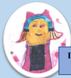
Происшествие в замке

Я не сказала. Он из соседней страны под названием ВкусноЛэнд. И очень любит кушать. Поэтому ему было интересно у моих прекрасных поваров и кондитеров.