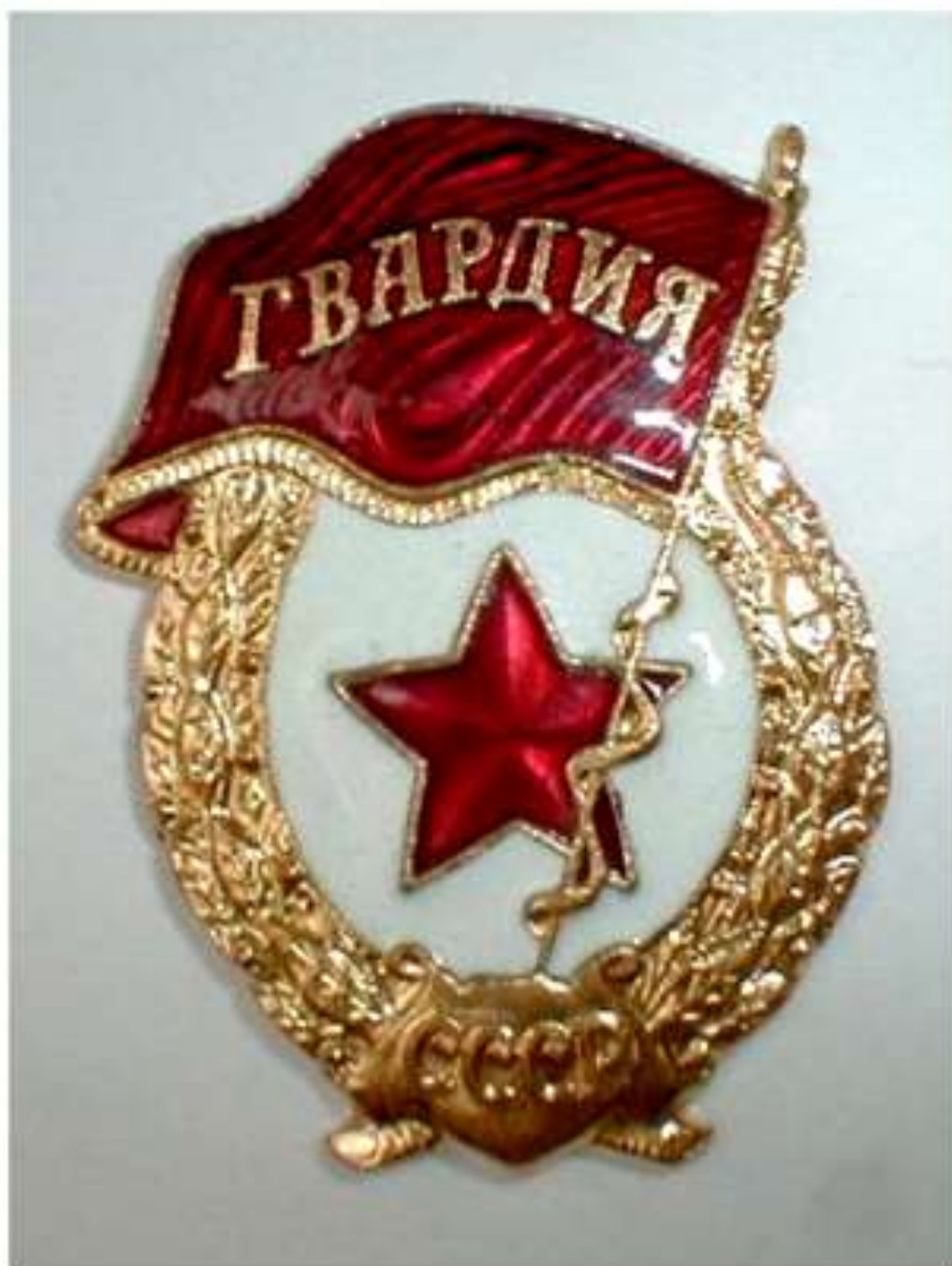
НАГРУДНЫЙ ЗНАК «ГВАРДИЯ»